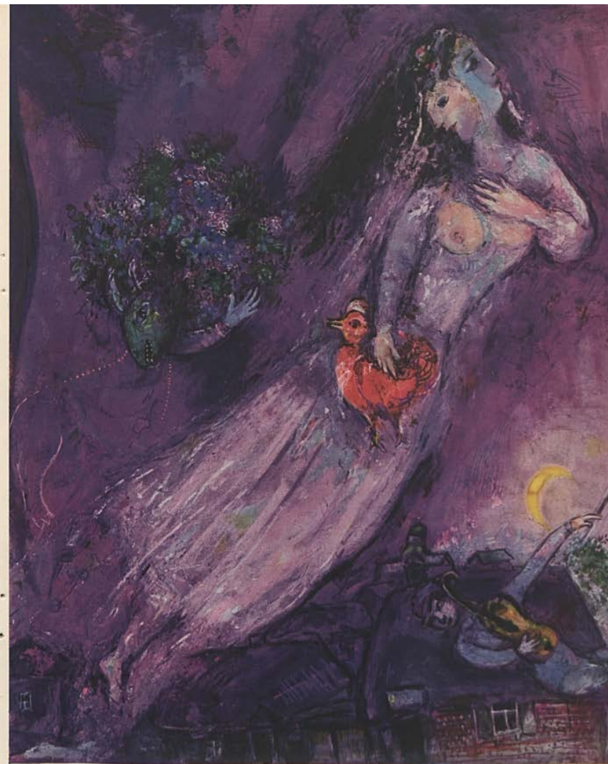
MARC CHAGALL: "TWO FACES OF HOPE," 1945